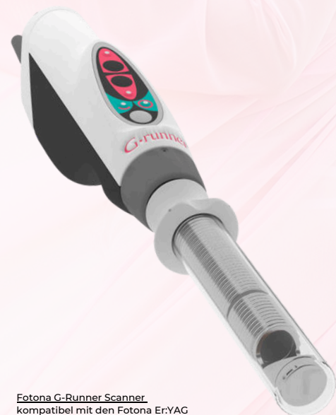
Fotona G-Runner Scanner kompatibel mit den Fotona Er:YAG Lasersystemen

Patienten: Wenn Sie weitere Informationen zu nicht-invasiven Behandlungsoptionen für gynäkologische Beschwerden suchen, besuchen Sie die Fotona SMOOTH®-Website für umfassende Details.